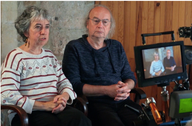
Fils de Garches de Rémi Gendarme-Cerquetti

Dans les années 1980, des enfants touché-es par une maladie neuromusculaire sont conduit-es à l'hôpital de Garches, près de Paris. Sous prétexte de soin, le but des médecins est de redresser leurs corps jugés difformes à l'aide "d'appareils de correction". "Il fallait qu'on soit droit pour être comme les autres. C'était plus de la normalisation qu'un réel besoin physiologique...", raconte une ancienne de ces enfants. Pendant des jours et des jours, iels sont maltraité-es dans d'atroces douleurs par les médecins, qui leur interdisent de se plaindre en leur affirmant que "c'est normal que ça fasse mal". Avec sa caméra, Rémi Gendarme-Cerquetti retourne sur les lieux