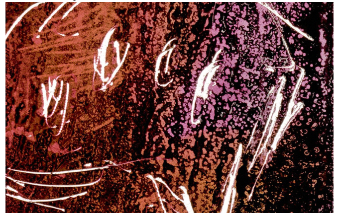
Dans ma tête d'Irina Tempea

Comment le pouvoir médico-social et les politiques sécuritaires produisent-elles le corps ? Comment