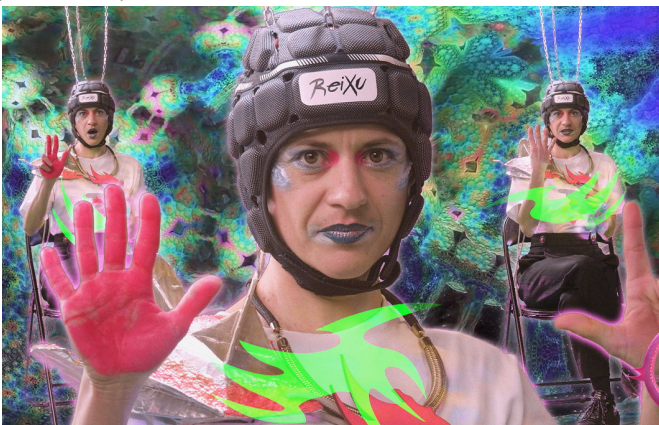
Theremespare de Hantédemos

Trois films où bouillonnent des visions tarées et des archétypes qui giclent. Une potion qui délivre, fait ricaner ou des frissons quand tout se déforme et s'accélère. Les trois films forment un