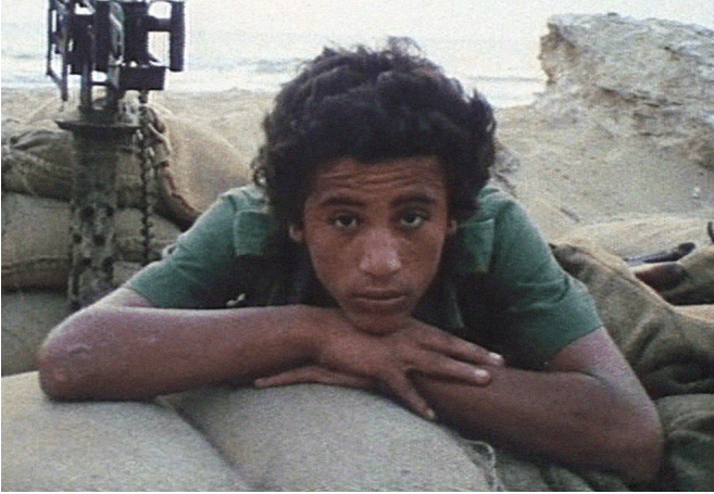
The Dream / al-Manam de Mohamad Malas

Empruntant son titre au film de Malas, sous-titré « une tentative non-documentaire d'entrer dans la mémoire de Wadad Nassif, Qunaitra, 1975 », ce programme de films explore le documentaire comme langage cinématographique au-delà de la preuve visuelle, comme rencontre avec l'irreprésentable suite à la catastrophe. Pourquoi tenir à rester dans sa maison après qu'Israël ait détruit toute vie autour? Pourquoi les réfugiés palestiniens rêvent d'une terre qu'ils n'ont jamais connue physiquement? Comment le travail du rêve peut-il servir à la mémoire, à la résistance, et donc au documentaire?