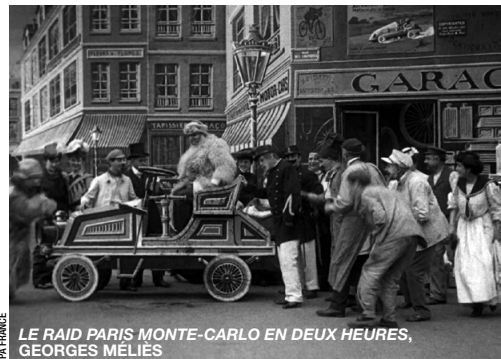
LE RAID PARIS MONTE-CARLO EN DEUX HEURES , GEORGES MÉLIÈS