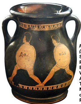
PÉLIKÉ (À ATHÈNES) SUIVEUR DU PEINTRE DES BAIGNEUSES. VERS 425 AV. J.-C. TERRE CUITE. Musée d'art et d'archéologie du Pays de Laon.

Dans le cadre de la nuit des musées, le Musée de La Poste propose un cycle d'œuvres cinématographiques en relation avec l'exposition Marathon, la course du messager .