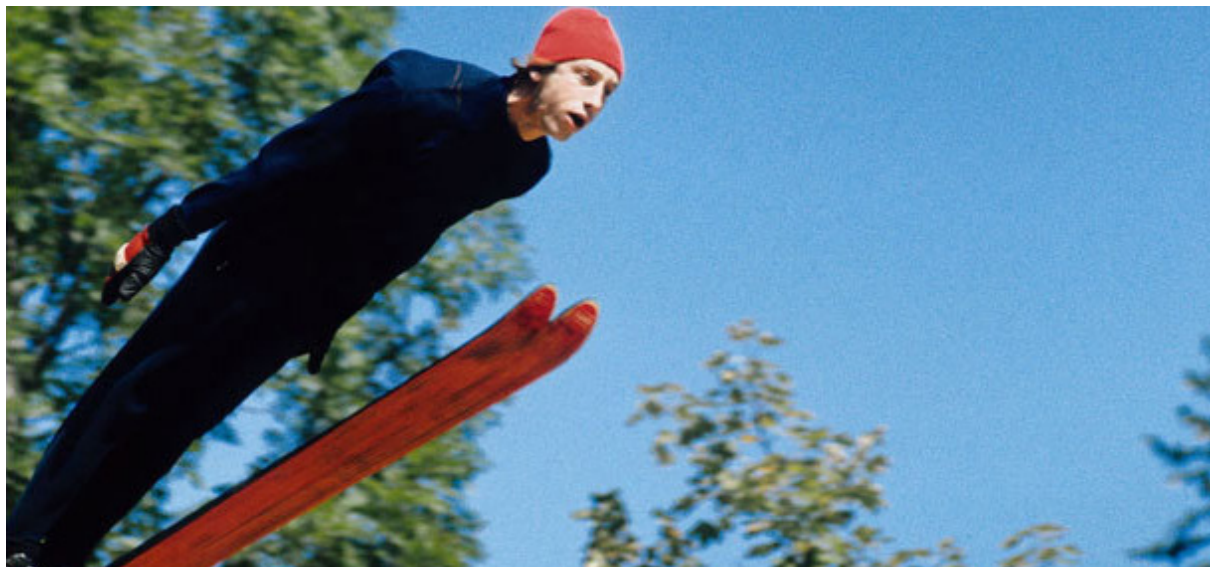
LA GRANDE EXTASE DU SCULPTEUR SUR BOIS STEINER, WERNER HERZOG