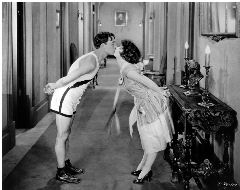
COLLEGE - SPORTIF PAR AMOUR, JAMES W. HORNE, BUSTER KEATON