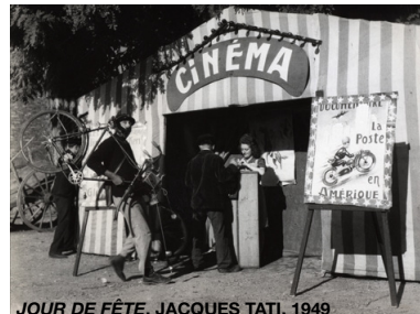
JOUR DE FÊTE, JACQUES TATI, 1949

Jean-Baptiste Morain, Les Inrocks , janvier 2004