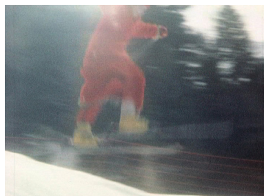
A SKI, RAPHAËLLE PAUPERT-BORNE