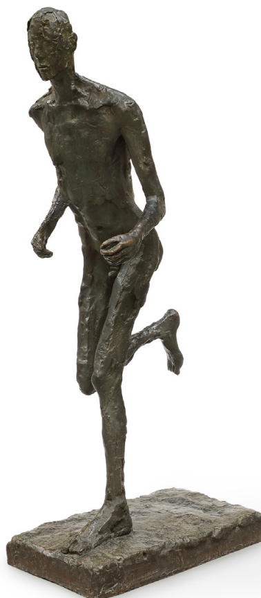
GERMAINE RICHIER, COUREUR , VERS 1955. BRONZE. CENTRE NATIONAL DES ARTS PLASTIQUES

© ADAGP, PARIS, 2024 / CMAP - CRÉDIT PHOTO : FABRICE LINDOR