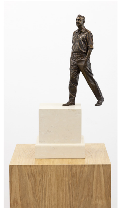
ÉLOGE DE LA DÉAMBULATION, PHILIPPE RAMETTE, 2022. BRONZE PATINÉ, PIERRE DE TAVEL IVOIRE, LAITON ET BOIS. COURTESY DE L'ARTISTE ET GALERIE XIPPAS PARIS © ADAGP, PARIS, 2024 - PHILIPPE RAMETTE - PHOTO : FREDERIC LANTEMIER

LE PASSAGER , 1974, Abbas Kiarostami FORZA BASTIA - L'ÎLE EN FÊTE , 1978, Jacques Tati COUP DE TÊTE , 1979, Jean-Jacques Annaud À NOUS LA VICTOIRE , 1981, John Huston À MORT L'ARBITRE , 1984, Jean-Pierre Mocky SHAOLIN SOCCER , 2000, Stephen Chow ZIDANE, UN PORTRAIT DU XXI e SIÈCLE , 2006, Douglas Gordon et Philippe Parreno