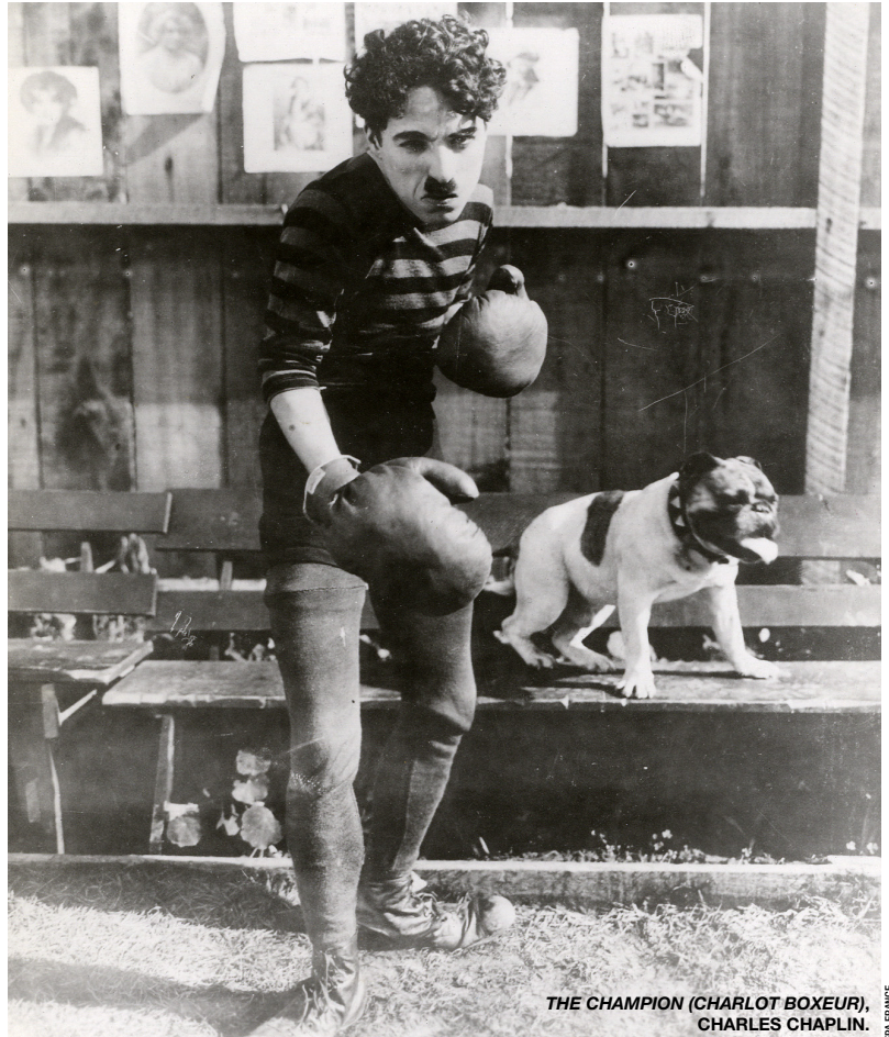
THE CHAMPION (CHARLOT BOXEUR), CHARLES CHAPLIN. FPA FRANCE

Le concept est simple : il s'agit de rassembler, montrer, programmer autour du sport des films d'auteurs. Le cinéma d'auteur est toujours à (re)voir pour (ré)activer la cinéphilie. Cela commence avec les opérateurs des frères Lumière qui filment des sportifs, en passant par le cinéma burlesque – Charlot Boxeur , Charlot patine , pour ne citer que Chaplin – en