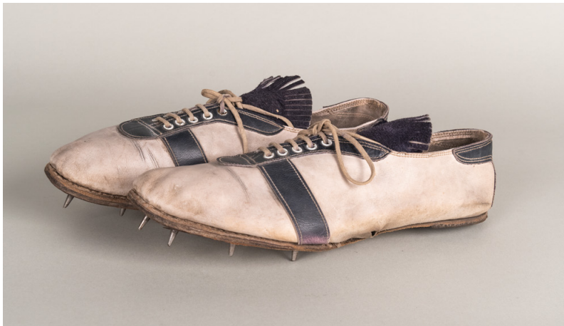
SANS TITRE (CHAUSSURES D'ALAIN MIMOUN), 1950. CUIR, TEXTILE ET MÉTAL

STRONG MAN / L'Athlète incomplet , 1926, Frank Capra LA SOLITUDE DU COUREUR DE FOND , 1962, Tony Richardson MARATHON MAN , 1978, John Schlesinger ON THE EDGE , 1986, Rob Nilsson