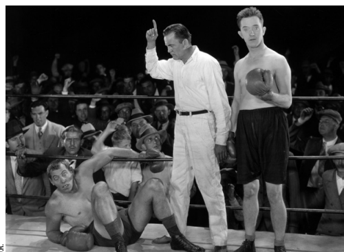
THE BATTLE OF THE CENTURY, CLYDE BRUCKMAN, HAL ROACH, LEO MCCAREY

Laurel doit affronter un redoutable adversaire dans un match de boxe où tous les coups sont permis. Les Laurel et Hardy ne sont pas des films pour enfants. Ils étaient tournés pour des gens de tout âge, misant sur un rire universel. Et leur jeunesse semble bien éternelle : près d'un siècle après leur tournage, les effets comiques sont intacts et fonctionnent comme au premier jour. Mark Twain disait que le meilleur moyen de tuer la poésie, c'est de l'expliquer. Alors cessons là cette tentative de présentation du duo. Pour ceux qui connaissent leurs films