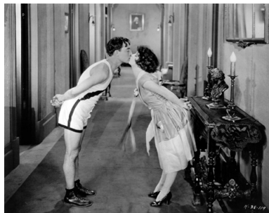
COLLEGE - SPORTIF PAR AMOUR , JAMES W. HORNE, BUSTER KEATON